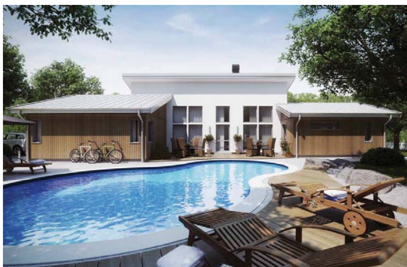
Vissa detaljer på bilderna kan vara tillval.

Sandliden är ett modernt, funkisinspirerat hus med öppen och ljusgivande planlösning. Utformningen ger god kontakt mellan husets inne- och uteplatser i flera väderstreck, liksom med trädgården. Vardagsrummet är centralt och har riktigt stora fönsterpartier. Här finns även en dörr till uteplatsen, som ligger i en skyddad vinkel mot köket.