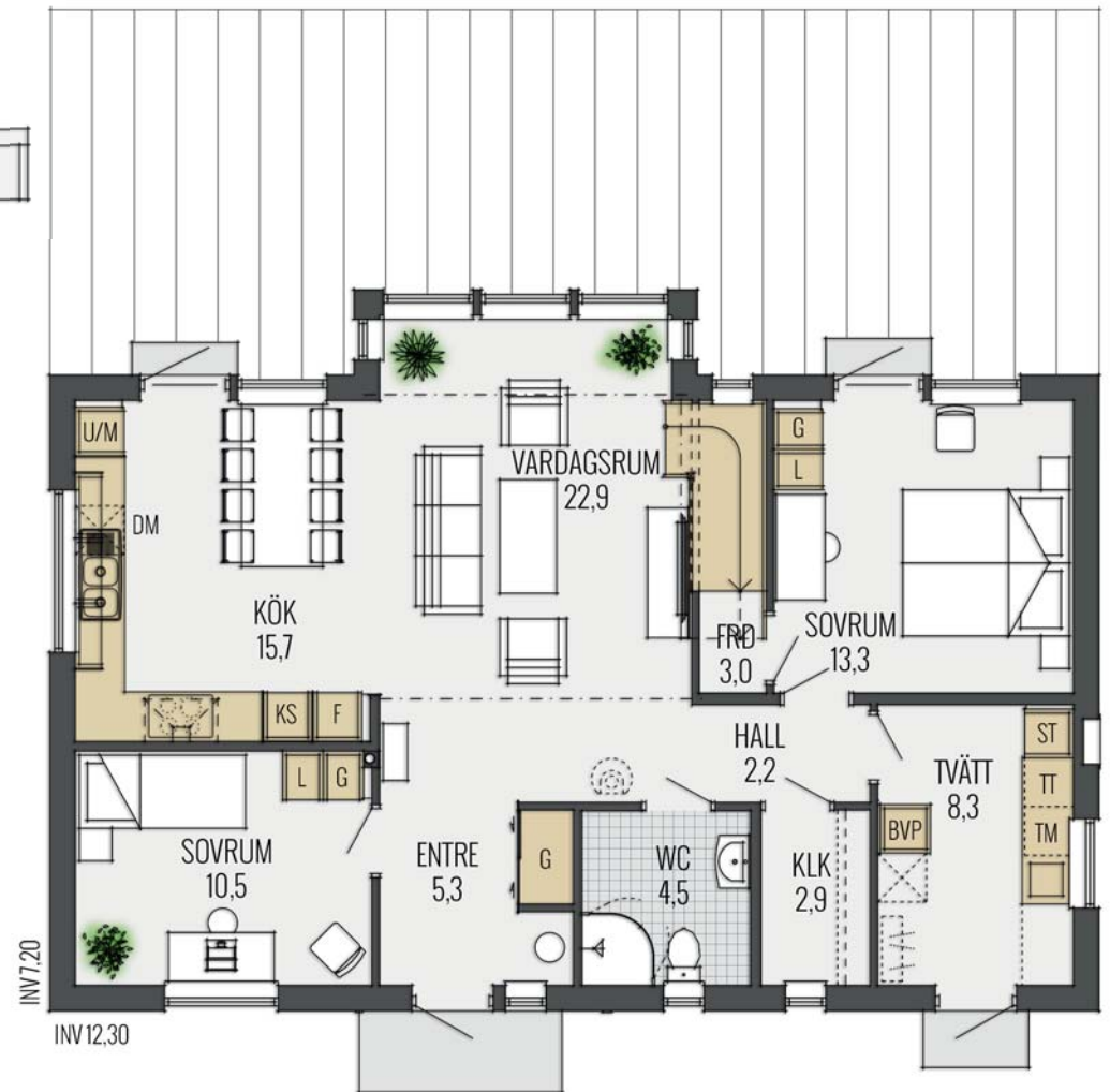
ENTRÉVÅNING 92 M 2

Med inredd övervåning får du ett stort generöst allrum för både avkoppling och lek. De tre sovrummen har olika karaktär och i det största sovrummet finns det också ett dressing room – med takfönster! Badrummet är väl tilltaget med plats för badkar. Låter det som om din vision har gått i uppfyllelse?